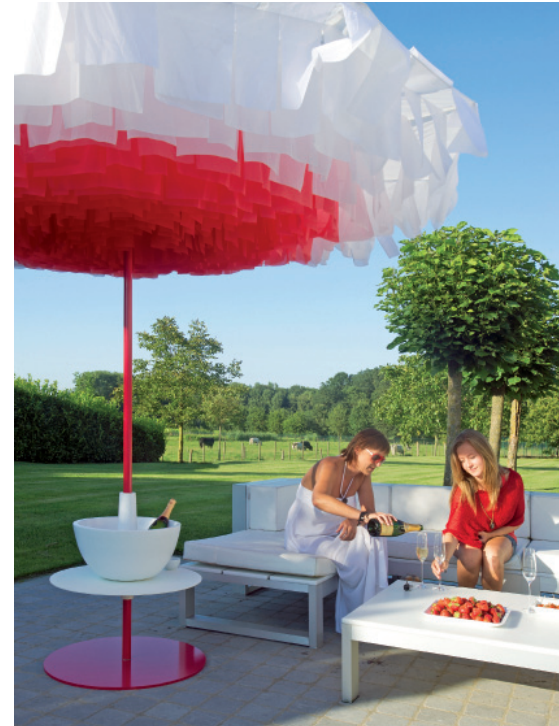
Ein Schirm, der seine Farbe ändert: Bloom von Sywawa.

Symo | Der belgische Hersteller Symo führt unter der Marke Sywawa den Sonnenschirm Bloom im Portfolio. Inspiriert wurde Designer Davy Grosemans bei der Entwicklung des ungewöhnlichen Stückes durch die Natur, genauer gesagt durch Blumen. Bloom zeichnet sich durch eine sehr flache Form aus. Dank ausgefeilter Technik wechselt seine Farbe von brilliantem Weiß zu Humbeerrot. Der Wind lässt die „Blütenblätter“ tanzen und entblättert sie – dadurch entsteht ein faszinierender Effekt. Der Schirm plustert sich förmlich auf und wechselt seine Farbe. Welche eine Überraschung für Gäste, die direkt darunter sitzen.