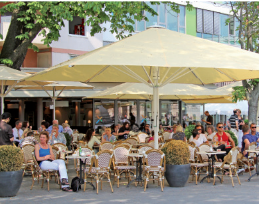
Beispiel für den Einsatz des Bahama-Großschirmes: Café „X-Trend“ in Braunschweig.

Bahama | Das Geschäft mit der Außengastronomie ist lukrativ, aber unglücklicherweise sehr vom Wetter abhängig. Hilfreich sind da allwettertaugliche Überdachungen wie es zum