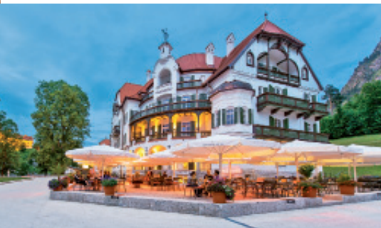
Mit Großschirmen von Glatz den Sommer verlängern, wie im Bild mit dem Modell Castello.

Glatz | Das Schweizer Unternehmen Glatz hat hochfunktionale Aluminium- und Holzschirme mit Mittelstock oder Freiarm in diversen Ausführungen, Größen, Formen, Farben und Funktionen im Programm. Mit diesen lassen sich die