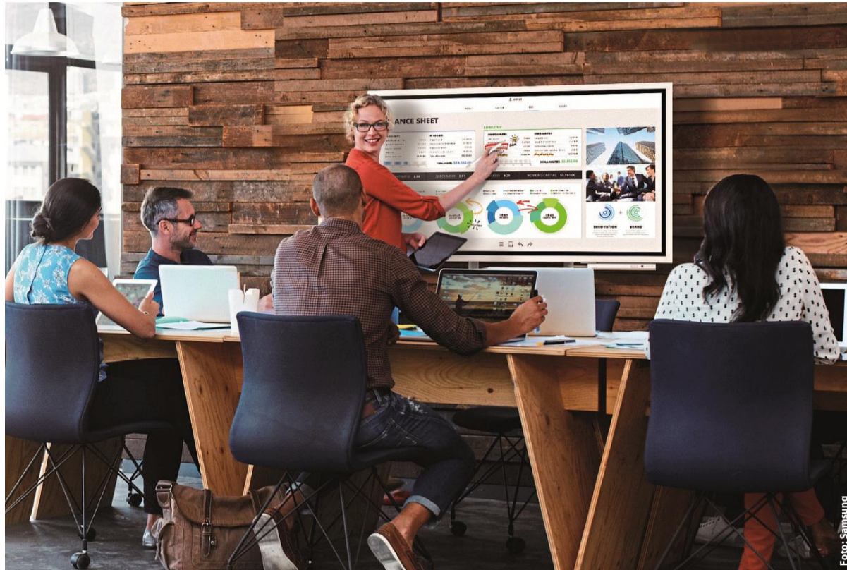
Multitalent: Das Samsung Flip stellt Tagungsteilnehmern sämtliche Inhalte digital zur Verfügung.