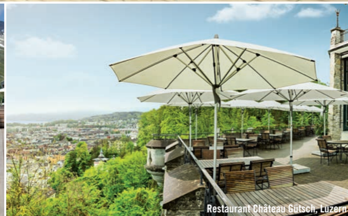
Restaurant Château Gütsch, Luzern

In de lounge of aan de bar: De kleine FORTINO® staat daar, waar schaduw gewenst is. Dankzij zijn formaat wisselt hij vaker van plaats dan een wisselbeker van eigenaar. Voor bedieningsgemak zorgt het tegengesteld lopende servo-principe: gewoon de spanhendel omlaag trekken en in de schuif hangen. Het frame is van natuurlijk geëloxeerd aluminium met een tweedelig geprofileerde mast. De FORTINO® beschikt over een stabiele constructie, is bestand tegen wind en kan in diverse voeten of in een grondpijp worden bevestigd.